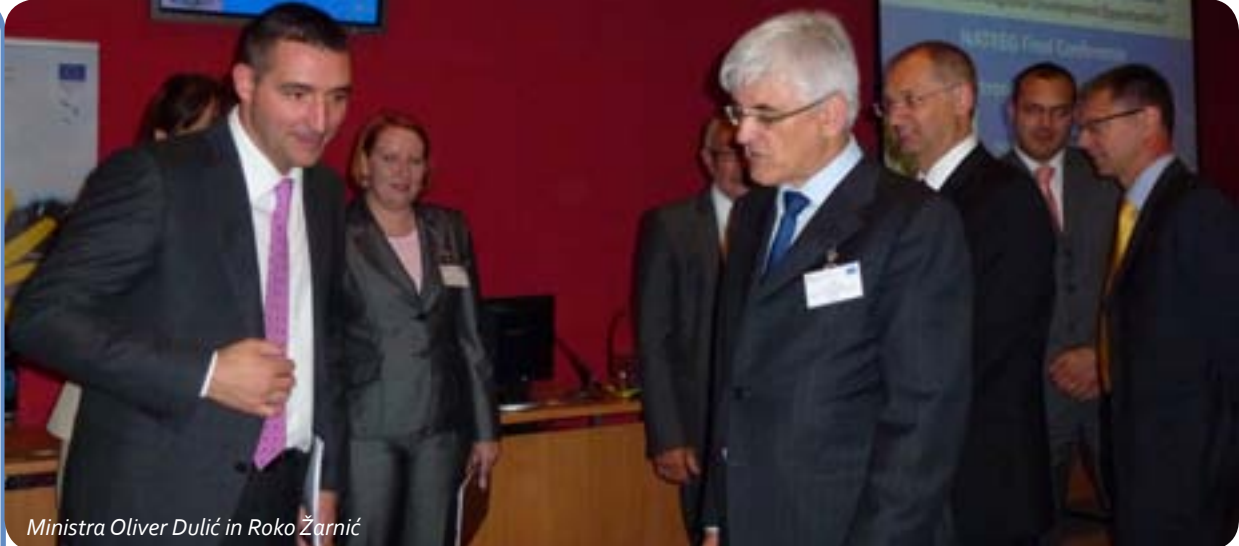
Ministra Oliver Dulić in Roko Žarnić